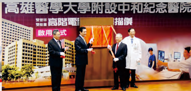
100年8月19日附設中和紀念醫院舉辦雙管球雙能量高階電腦斷層掃描儀啟用典禮敬邀馬總統蒞臨揭幕儀式